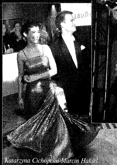
Katarzyna Cichopek i Marcin Hakiel