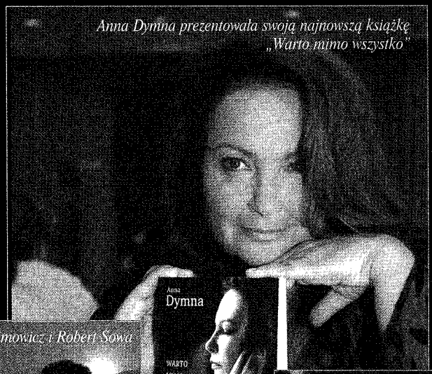
Anna Dymna prezentowała swoją najnowszą książkę „Warto mimo wszystko”