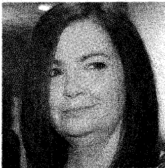
▲ Anna Dymna

Anna Dymna od lat działa na rzecz osób niepełnosprawnych, uchodźców, ludzi w trudnym położeniu. Wspiera ośrodek dla niepełnosprawnych umysłowo w Radwanowicach pod Krakowem, prowadzi Fundację Mimo Wszystko. W