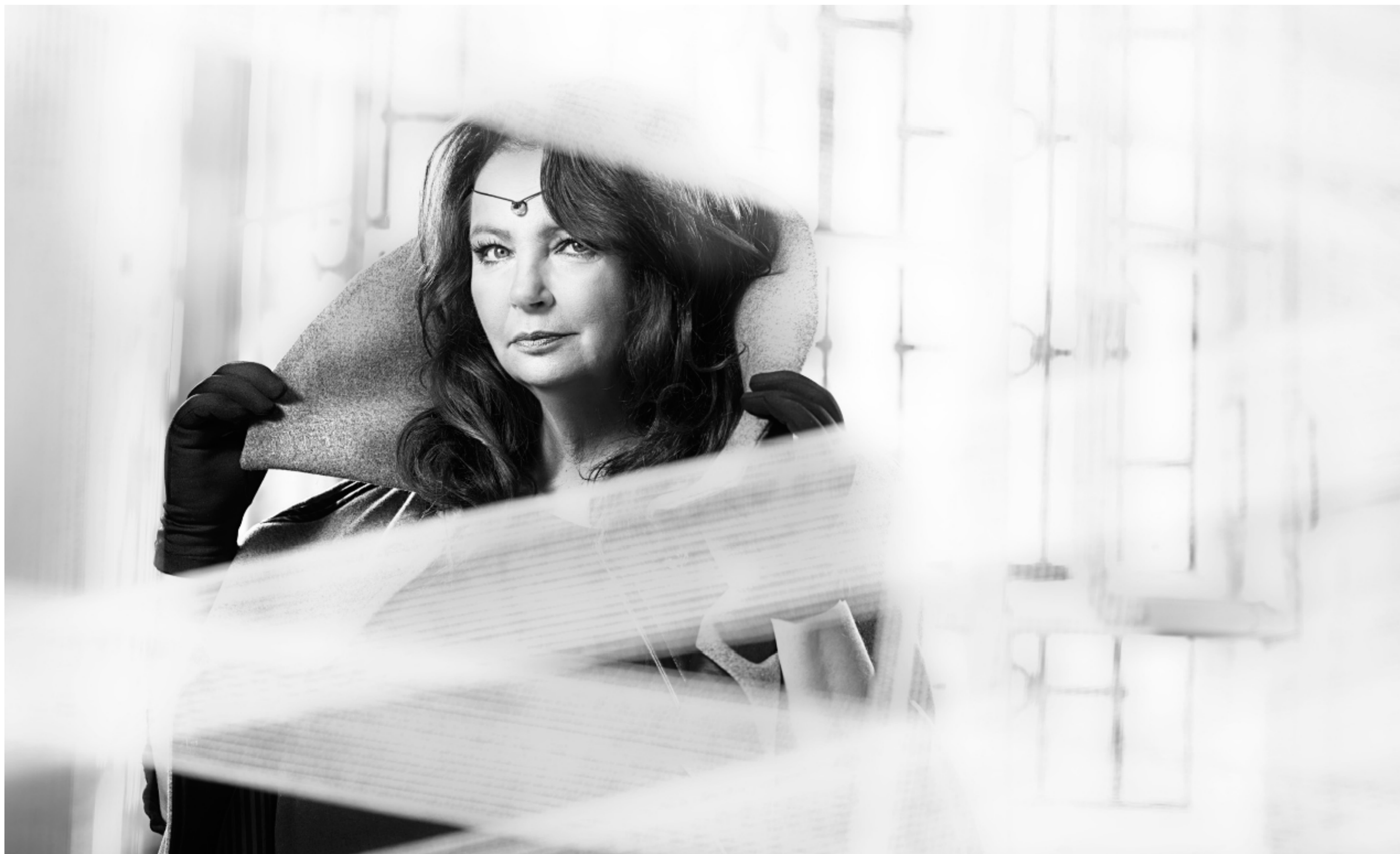
FOT. DANIEL RACZYŃSKI/EPITAFIUM DLA BARBARY RADZIWIŁOWY/

Czas nadaje życiu sens, choć płynie nieubłaganie. Młodość i jej uroda, zamknięte w filmowych kadrach, stają się wspomnieniem. Jednak radość, miłość, pasja - choć biegną poganiane czasem - bywają nieśmiertelne.